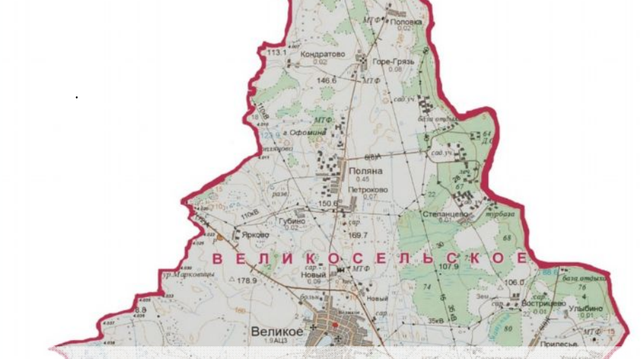
На территории сельского поселения рисков возникновения техногенных пожаров нет